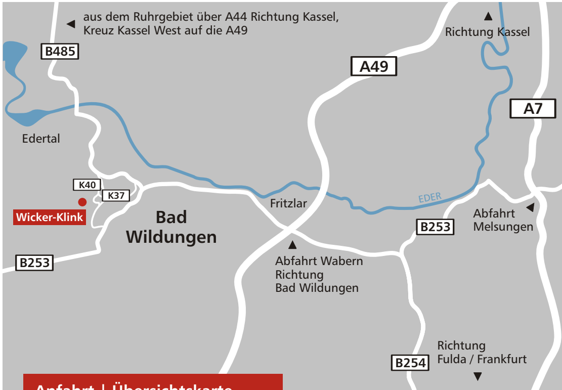
Anfahrt | Übersichtskarte

Telefon 05621 792-0 Fax 05621 792-695 E-Mail info@wicker-klinik.de Internet www.wicker-klinik.de